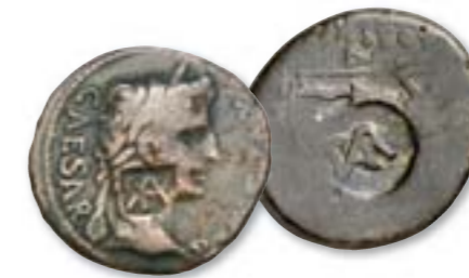
Zwei römische Münzen mit Gegenstempel des Varus. Der Statthalter verteilt die Münzen als Geldgeschenke. Der Stempel zeigt jedem, wem er das Geld zu verdanken hat.

Ab 6 n. Chr. hält sich Varus als Statthalter sehr wahrscheinlich in Haltern auf. Hier ist die 19. Legion stationiert. Im Sommer 9 n. Chr. ist sie von Haltern aus aufgebrochen und zusammen mit der 17. und der 18. Legion unter dem Befehl des Varus in Germanien unterwegs, um römische Macht und Stärke zu demonstrieren.