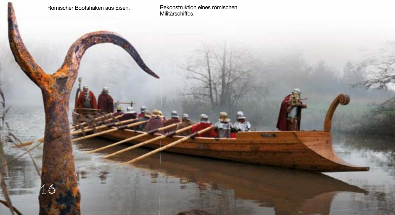
Rekonstruktion eines römischen Militärschiffes.