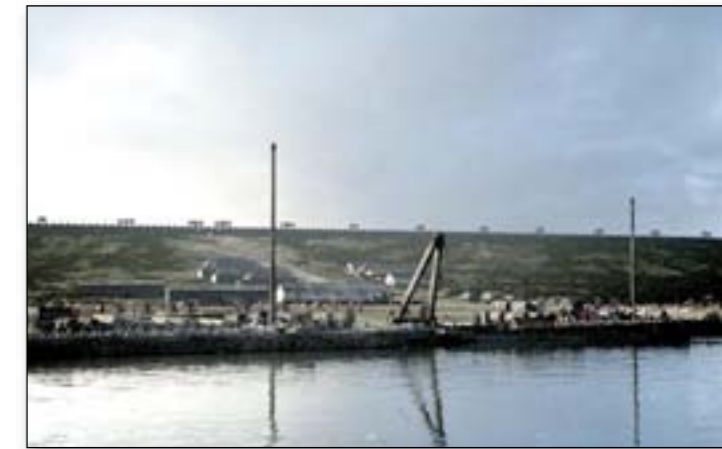
Hafenanlage mit Ladekran zum Entladen der Lastkähne beim Bootslager in Haltern.

baren Flüssen angelegt. Zu den römischen Militäranlagen von Haltern gehört auch eine Marinebasis mit Schiffshäusern.