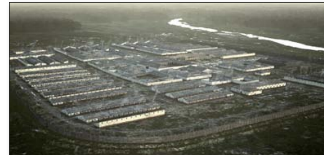
Das Legionslager von Haltern ist durch Spitzgräben und eine Holz-Erde-Mauer geschützt. Es hat fest gebaute Kasernen und Verwaltungsgebäude.