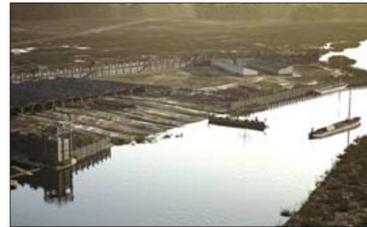
Ein Militärschiff legt bei den Schiffshäusern von Haltern an.